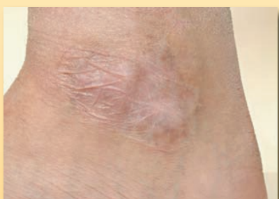
popáleniny prvního stupně

Aplikujte silnou vrstvu (3-5 mm) Flamigelu na ránu 1-2x denně (nevtírejte do kůže). V případě spálenin od slunce aplikujte 2-6x denně, případně dle potřeby.