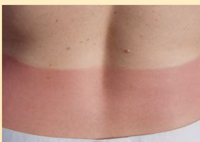
spáleniny od slunce